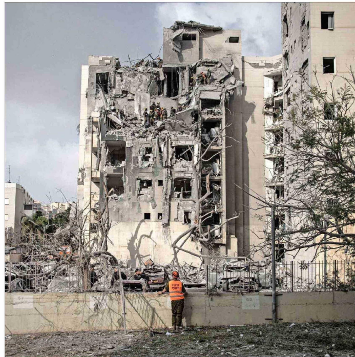
UN ATAQUE de última hora iraní destruyó un edificio residencial en la ciudad israelí de Beersheva.

La tregua entre Israel e Irán fue anunciada el lunes por la noche por el Presidente de EE.UU., Donald Trump, luego de un ataque de represalia iraní contra una base militar estadounidense en Qatar que fue calculado para no provocar víctimas. A las pocas horas de iniciado el cese del fuego, sin embargo, ambas partes denun-