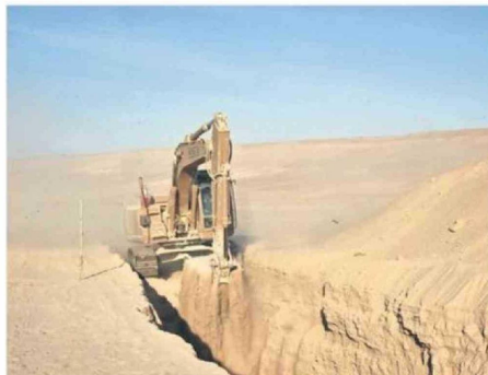
EL PLAN ESCUDO FRONTERIZO, IMPLEMENTADO POR EL GOBIERNO DEL PRESIDENTE KAST, BUSCA ENFRENTAR DE MANERA CONCRETA LA CRISIS MIGRATORIA A TRAVÉS DE UN TRABAJO QUE CONSIDERA TRES CAPAS: TECNOLOGÍA, INFRAESTRUCTURA Y PATRULLAJE MILITAR.