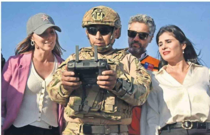
EL MINISTERIO DE OBRAS PÚBLICAS Y EL EJÉRCITO DE CHILE TRABAJAN CONSTRUYENDO LAS ZANJAS.

E n el marco de su visita a la Región de Arica y Parinacota, la ministra secretaria general de Gobierno, Mara Sedini, se dirigió hasta la frontera de Chile y Perú para constatar en terreno el avance de la zanja, obra que forma parte del Plan Escudo Fronterizo que busca reforzar la seguridad en el norte del país.