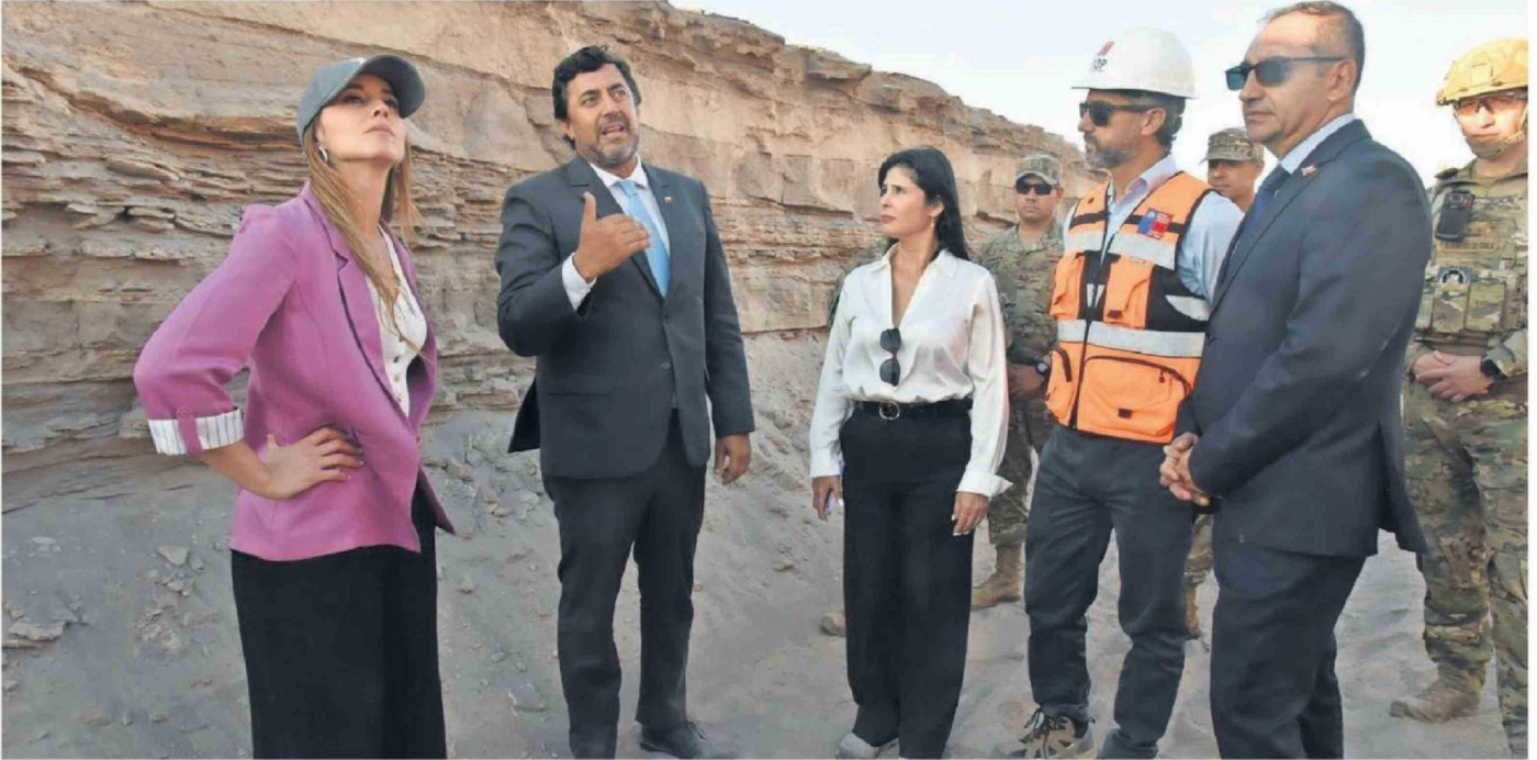
DURANTE LA VISITA, LA VOCERA DE GOBIERNO PUDO INSPECCIONAR LA OBRA QUE LLEVA UN 40% DE AVANCE, LO QUE SE TRADUCE EN MÁS DE 3 MIL METROS CONSTRUIDOS.