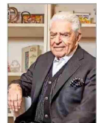
El animador conducirá programa de entrevistas.

Don Francisco y su regreso a Univisión a los 85 años: "Me sigue emocionando comunicar" | C 12