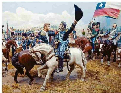
EL ABRAZO DE MAIPÚ, EN ESTACIÓN DEL METRO PLAZA DE MAIPÚ.

Desde aldeas precolombinas y Pedro de Valdivia en el cerro Huele, hasta la batalla de Rancagua y el abrazo de Maipú, pasando por el alto horno de la CAP, los pampinos del caliche, el ambiente de una escuela rural del sur y el paseo peatonal Barros Arana de