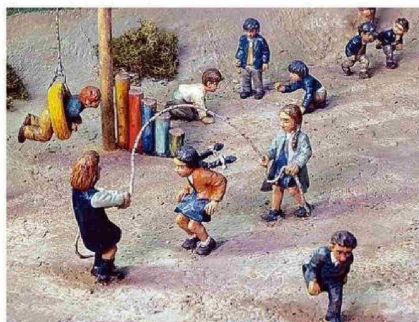
DETALLE DE ESCUELA BÁSICA RURAL. MINISTERIO DE EDUCACIÓN.

- ¿Y los muchos premios que ha merecido por su trabajo?