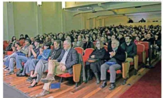
MIGUEL BUSTOS/UNO NOTICIAS