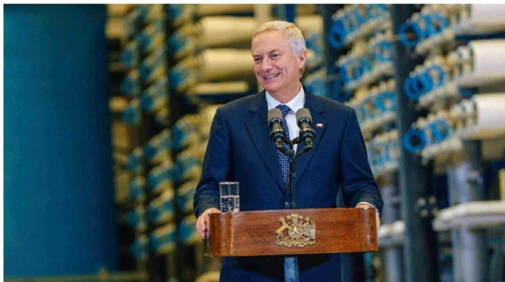
► El Presidente José Antonio Kast.

Sus palabras desataron críticas inmediatas desde la oposición, donde acusaron al gobierno de intentar justificar el recor-