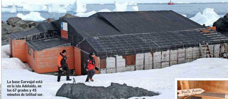
La base Carvajal está en la isla Adelaida, en los 67 grados y 45 minutos de latitud sur.

El recinto situado al sur de la isla Adelaida funcionó durante los veranos por tres décadas, hasta 2015. Ayer se revisó su estado, mientras el Instituto Antártico Chileno planea levantar una estación en el mismo lugar.