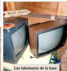
Los televisores de la base son incompatibles con las plataformas digitales actuales.