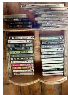
En la colección de casetes y discos compactos hay desde marchas hasta rock latino.

lefacción, planta de tratamiento y un compactador de basura.