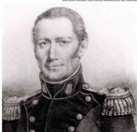
JUAN MACKENNA PROYECTÓ PARQUES EN LAS COLINAS DE PILAUICO.

Estando Juan Mackenna en la materialización de esa iniciativa, recibió una misiva del Cabildo de Santiago donde le co-