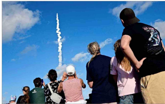
Cerca de 400 mil personas vieron en directo el lanzamiento de la misión Artemis II. En la foto, el público que se apostó cerca del puente A. Max Brewer en Titusville, Florida.

En la previa, los tripulantes de la Estación Espacial Internacional mandaron por video un saludo a sus colegas antes de comenzar el periplo. “Estamos honrados de desear a nuestros compañeros exploradores un buen viaje. A lo largo de la historia humana, la Luna ha despertado