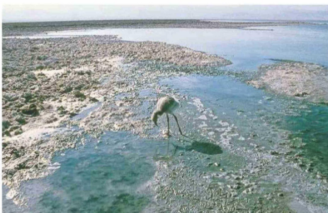
LA PRESENCIA DE POLLUELOS EN LAS LAGUNAS ALTOANDINAS RODEADAS DE SILENCIO ABSOLUTO.

Vuelve a cobrar relevancia como documento clave para la memoria histórica, cultural y ambiental del norte.