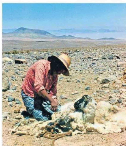
REGISTRO DE LA VIDA COTIDIANA EN LOCALIDADES DEL INTERIOR.