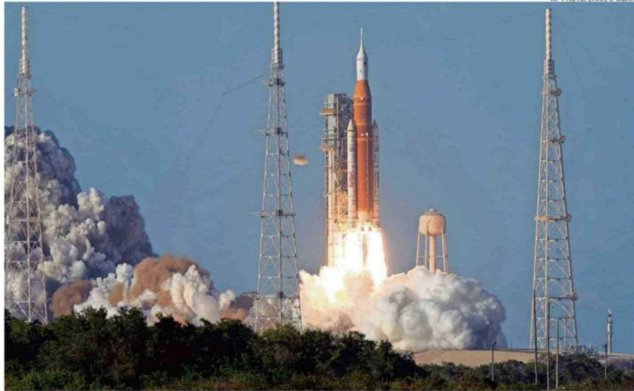
El despegue ocurrió según lo previsto, pasadas las 19:30 horas en Chile.

Antes del trayecto a la plataforma, los astronautas juga-