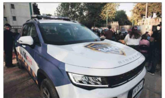
Las nuevas camionetas significaron una inversión de 400 millones de pesos, que fueron financiados por el Gobierno Regional de Santiago a través del Fondo Nacional de Desarrollo Regional (FNDR).