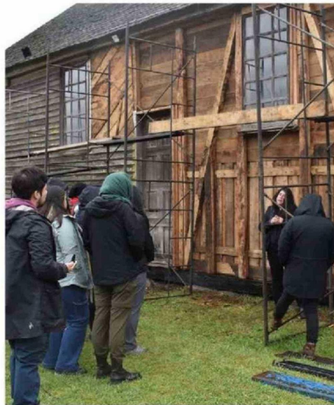
LAS RESTAURACIONES SE VERÍAN AFECTADAS CON LOS RECORTES.

pero también es momento de corregir, porque nuestro patrimonio no puede seguir cayéndose a pedazos”, enfatizó el chilote.