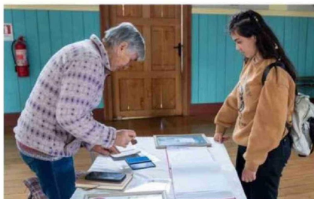
APERTURA TURÍSTICA DE LAS IGLESIAS CON EL USO DEL PASAPORTE SERÍA UNO DE LOS “DAMNIFICADOS” SIN LOS RECURSOS DE BASE.

Este programa, que cuenta con un presupuesto cercano a los $1.894 millones, también financia sitios Parque Rapa Nui, el Barrio Histórico de Valparaíso, las oficinas salitreras Humberstone y Santa Laura, Sewell,