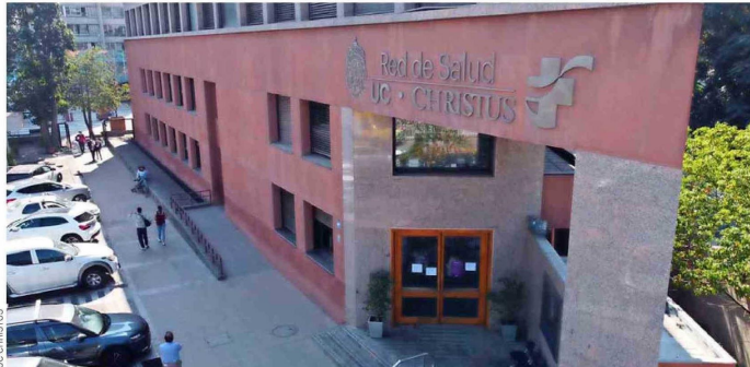
El Centro del Cáncer de UC CHRISTUS brinda una atención médica integral.

Con una atención personalizada y tecnología de vanguardia, este centro médico se encuentra desarrollando un amplio programa de terapias celulares.