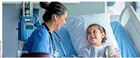
El paciente y sus familias son el centro de la atención que brinda UC CHRISTUS.

Con respecto al uso y porcentaje de éxito a nivel mundial y por qué es importante que se desarrolle este tipo de terapias en Chile, el director del Centro del Cáncer de UC CHRISTUS sostiene que "el uso y el porcentaje de éxito de las terapias celulares varían según el tipo de cáncer y la