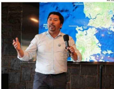
EL MUNICIPIO FUE UNO DE LOS EXPOSITORES DE LA JORNADA