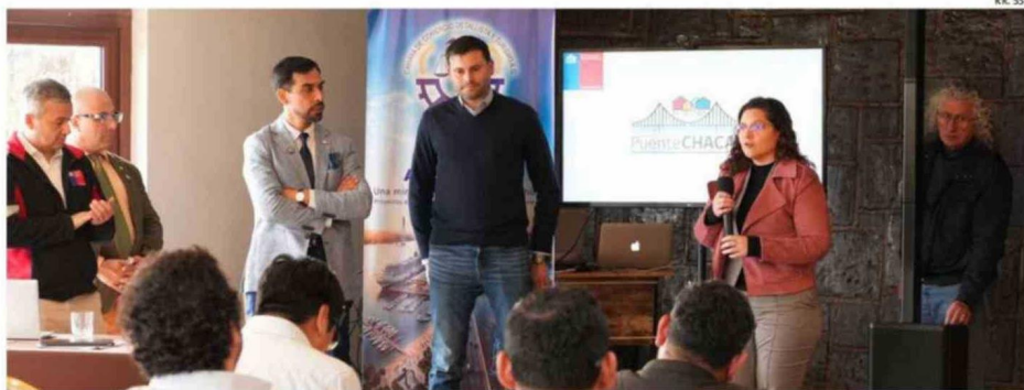
EL MOP PRESENTÓ LA CARTERA DE PROYECTOS DEL MINISTERIO PARA LA COMUNA Y LA PROVINCIA.