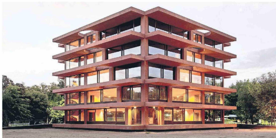
Centro de Innovación INES, obra de la firma Pezo von Ellrichshausen.

"La verdad es que el museo busca trabajar con diferentes públicos. Por una parte está el público interno de la universidad, al cual buscamos motivar, del mismo modo que a la comunidad universitaria en general. Creemos que tiene que ver con el diálogo que podemos generar en las diversas instancias -como el Día del Patrimonio Cultural- y combinamos la entrega del conocimiento con la generación de pensamiento crítico y la valorización de la cultura, mucho más allá de Marta Colvin", explica.