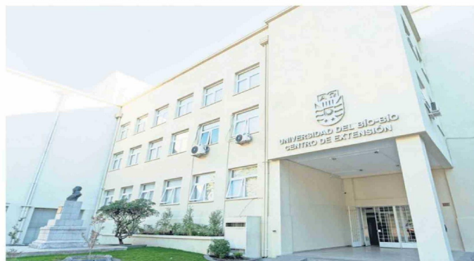
Centro de Extensión UBB en Chillán, actualmente sede de la Dirección de Extensión y otras unidades universitarias.

Prueba de esto es el rol clave que cumple la Universidad del Bio-Bío en la habilitación del Polo de Salud, con el respaldo del Gobierno Regional de Nuble. La apertura de la carrera de Medicina, además de Química y Farmacia, aborda un aspecto que hasta ahora no se desarrollaba en Nuble. Esto, a su vez, abre nuevos desafíos para la habilitación de un Polo Cultural en la joven región, a mediano y largo plazo.