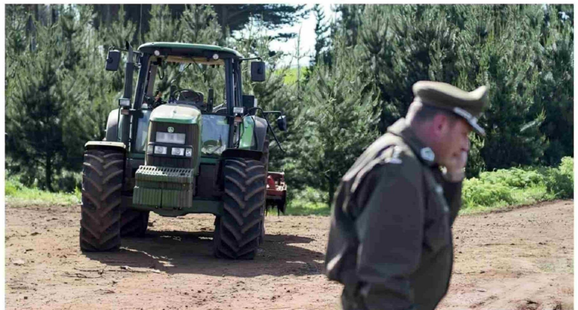
LA INICIATIVA SURGE frente a la ausencia de políticas públicas que aborden la seguridad rural.

El Observatorio de Delitos Rurales, que contará con el soporte técnico de la consultora Leadetik, pretende georreferenciar los puntos críticos de robo en las comunas con mayor prevalencia, como es el caso de Mulchén, donde el abigeato es el ilícito más frecuente. El gremio también busca detectar las cadenas de reducción de especies y reventa de agroquímicos, que hoy operan sin control en la zona.