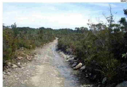
LOS CAMINOS SON PRIORIDAD PARA EL PLAN EN LA ZONA COSTERA.

Agregó que las principales necesidades de las localidades costeras sanpablinas apuntan a la conectividad vial, mejoramiento de caminos como la Ruta 220, que requiere asfaltado, al