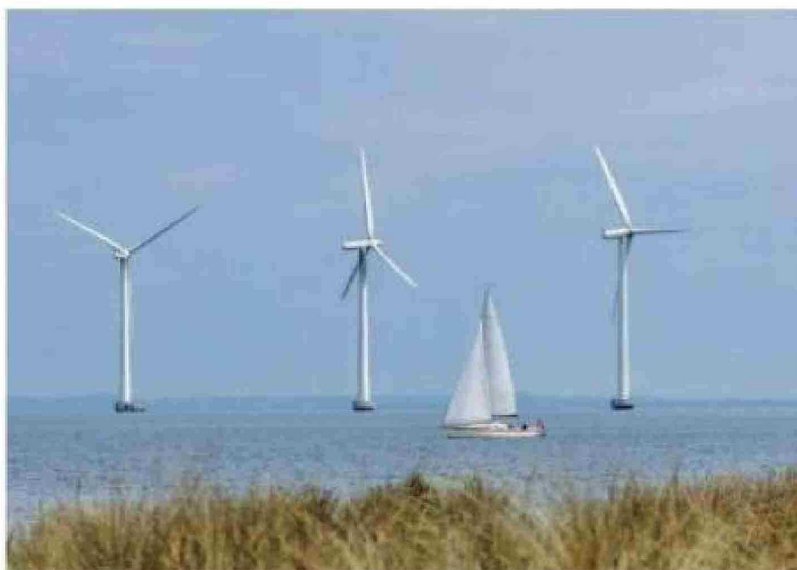
Los aerogeneradores son cada vez más altos y sus palas más grandes, en un intento de captar más energía del viento.

Si los operadores o países intentan evitar estos efectos de estela asegurándose las mejores ubicaciones, se puede generar otro riesgo, advierte: lo que se conoce como el fenómeno de la "carrera hacia el agua, en el que los estados apresuran el desarrollo para aprovechar los mejores recursos eólicos