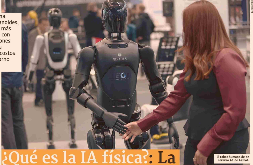
El robot humanoide de servicio A2 de Agibot.