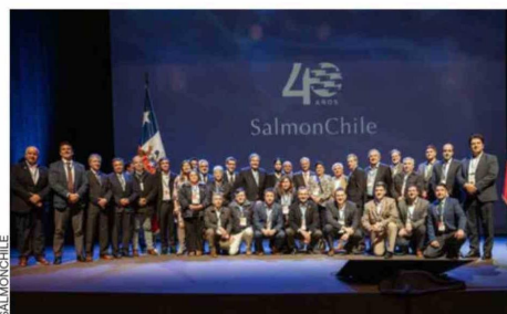
El foro, realizado en el Teatro del Lago en Frutillar, reunió a representantes de la salmonicultura, autoridades, empresariado y el mundo académico, con el fin de abordar los desafíos y oportunidades que enfrenta la actividad acuícola nacional.