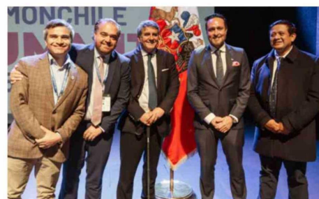
Marcelo Santana, gobernador regional de Aysén; Sergio Giacaman, gobernador regional del Biobío; Alejandro Santana, gobernador regional de Los Lagos; Rodrigo Wainraihgt, alcalde de Puerto Montt, y Marco Silva, alcalde de Calbuco.