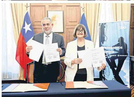
Con este acuerdo, las instituciones tendrán la oportunidad de compartir conocimientos.