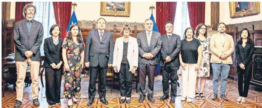
El convenio entre CGE y la Universidad de Chile permitirá desarrollar en conjunto iniciativas que permitan potenciar la cooperación técnica, investigación, asesorías y otras actividades.

Tiraje: 10.000 Lectoría: 30.000 Favorabilidad: No Definida