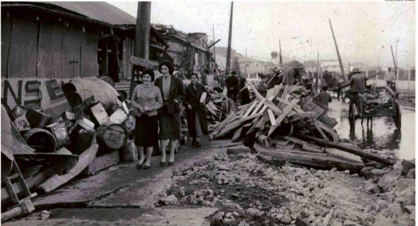
TÓTILA LINTZ STANGE