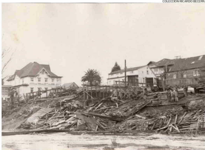
DAÑOS EN LA CIUDAD DE OSORNO, RIBERA DEL RÍO DAMÁS.

“Esto representa una complejidad que debe ser abordada previo a la activación de situaciones que generen emergencias tales como terremotos o erupciones volcánicas”, concluyó el también máster en Gestión y Reducción del Riesgo de Desastres y Catástrofes. CB