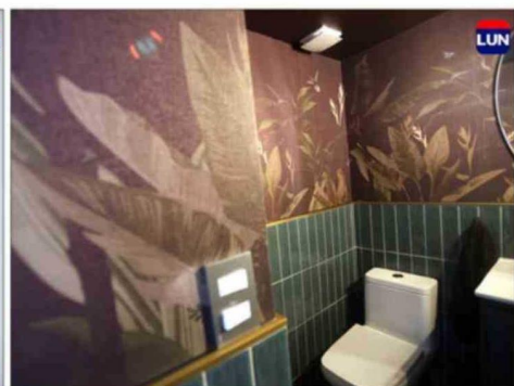
El papel mural selvático dio la pauta para el sonido ambiental: animales salvajes.

mos desde un dispositivo. Cuando vienen visitas, lo prendemos. Sentíamos que esos colores y texturas diferentes también tenían que estar representados auditivamente”.