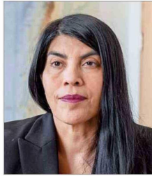
Ximena Lincolao , ministra de Ciencia.

El jefe de la cartera de Relaciones Exteriores anotó 19 participaciones en el ítem de comunidades, sociedades y empresas. También incluyó cuatro cuotas