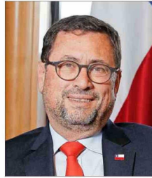
Francisco Pérez Mackenna , canceller.