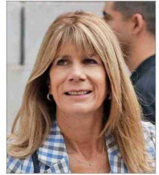
Ximena Rincón , ministra de Energía.