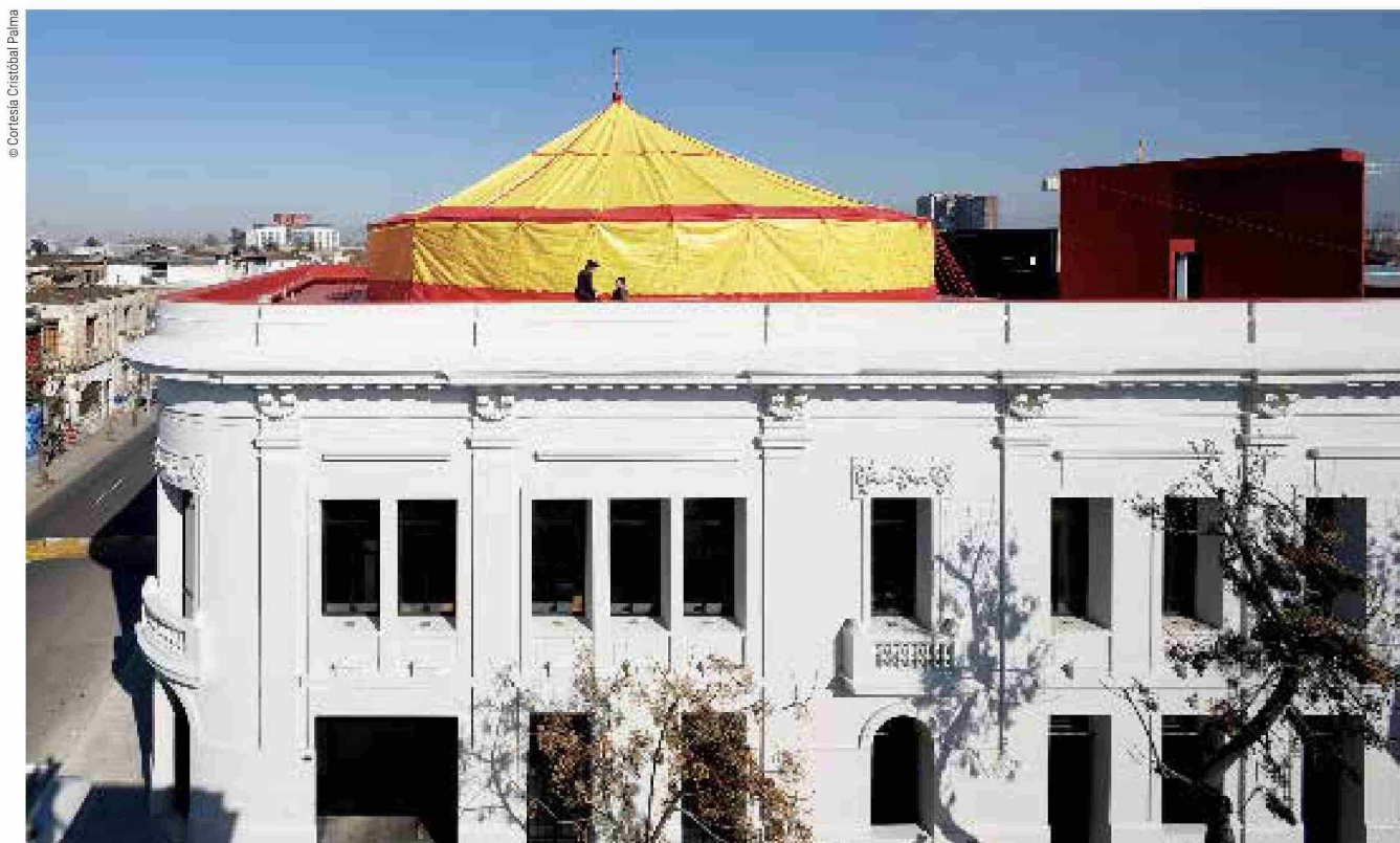
Para el centro de danza Nave (2015), en Santiago, el arquitecto chileno intervino un edificio neoclásico anteriormente arruinado.