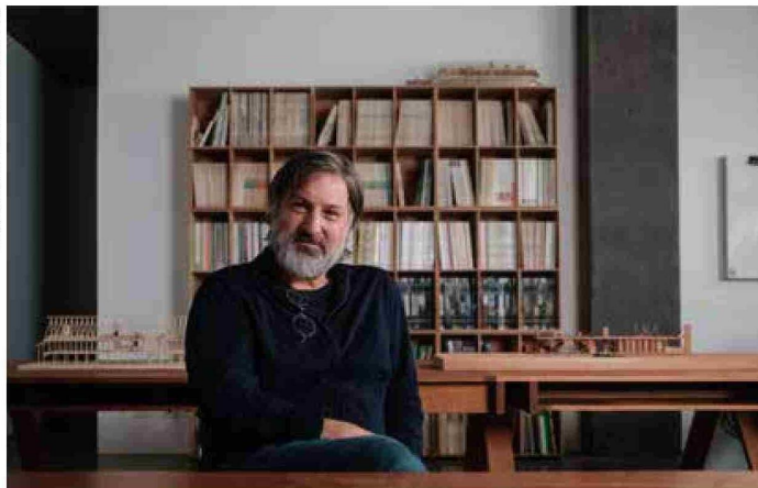
Smiljan Radić Clarke