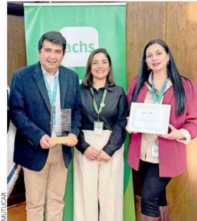
A lo largo de su historia, la Corporación ha recibido varios reconocimientos.

biológico tomó por sorpresa a todo un planeta, y nosotros no fuimos la excepción. Nos sentimos paralizados en un momento frente a algo desconocido, pero debíamos continuar. No sabíamos por cuánto tiempo estaríamos expuestos a este nuevo riesgo y sus consecuencias, y tras las medidas implementadas a nivel país, rápidamente iniciamos el proceso de adaptarnos a la modalidad de teletrabajo, en que debíamos entregar las medidas de confort necesarias para que nuestros colaboradores siguieran operando desde sus hogares. Se redujo significativamente la presencialidad e implementamos las medidas de seguridad requeridas para reducir los contagios, obteniendo así el Sello Covid otorgado por nuestro organismo administrador. Hoy, seguimos aplicando varios de estos