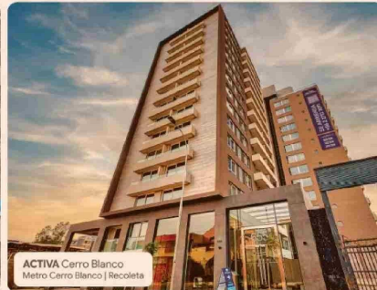
ACTIVA Cerro Blanco Metro Cerro Blanco | Recoleta