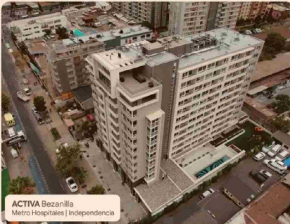
ACTIVA Bezanilla Metro Hospitales | Independencia