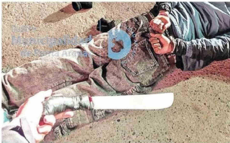
Peleas callejeras y el uso de armas blancas son parte de las preocupaciones de la dirección y el personal de Seguridad Municipal.

- "Es una diferencia muy grande, porque en el mundo uniformado, donde 23 años de mi vida fui carabinero, la institución funciona de otra forma. Acá, entrar al mundo público civil ha sido un cambio notorio para mí, pero me he adaptado bastante bien. Tengo gente muy profesional que está conmigo. Muy buena, que está dispuesta a trabajar por la gente, brindando una buena atención al público".