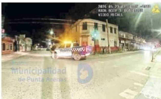
La acción de los funcionarios de Seguridad Municipal es permanente en las calles.

- "Por lo general son por distintos procedimientos. Tanto por accidentes de tránsito, alumbrado público, con-