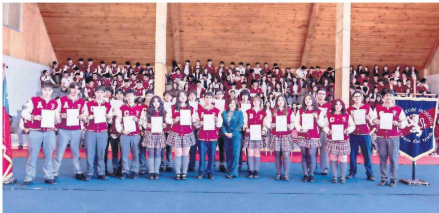
Cambridge University acreditó al colegio como centro preparador del FCE.

Hoy, Preston School atraviesa una etapa de maduración pedagógica