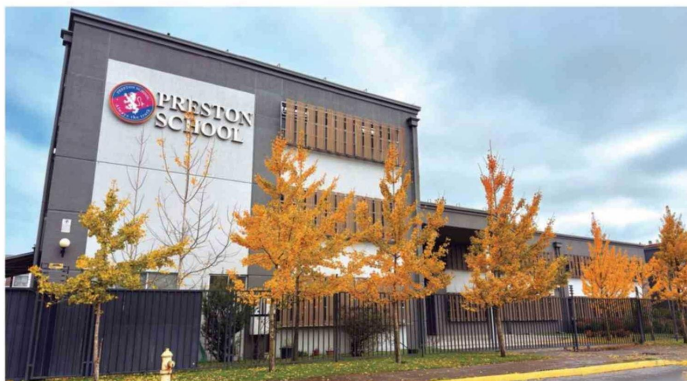
Infraestructura de vanguardia que proyecta ampliarse en 650 m 2 con madera contralaminada (CLT) traída desde Italia.

El proyecto contempla la construcción de 650 m 2 , un salón cultural multifuncional, concebido como centro de encuentro para el arte, la música y el pensamiento; una capilla orientada a la reflexión y el discernimiento vocacional bajo el lema "Entramos para aprender y salimos para servir"; y