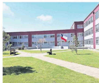
Un entorno que refleja la calidez y solidez del Proyecto Educativo.