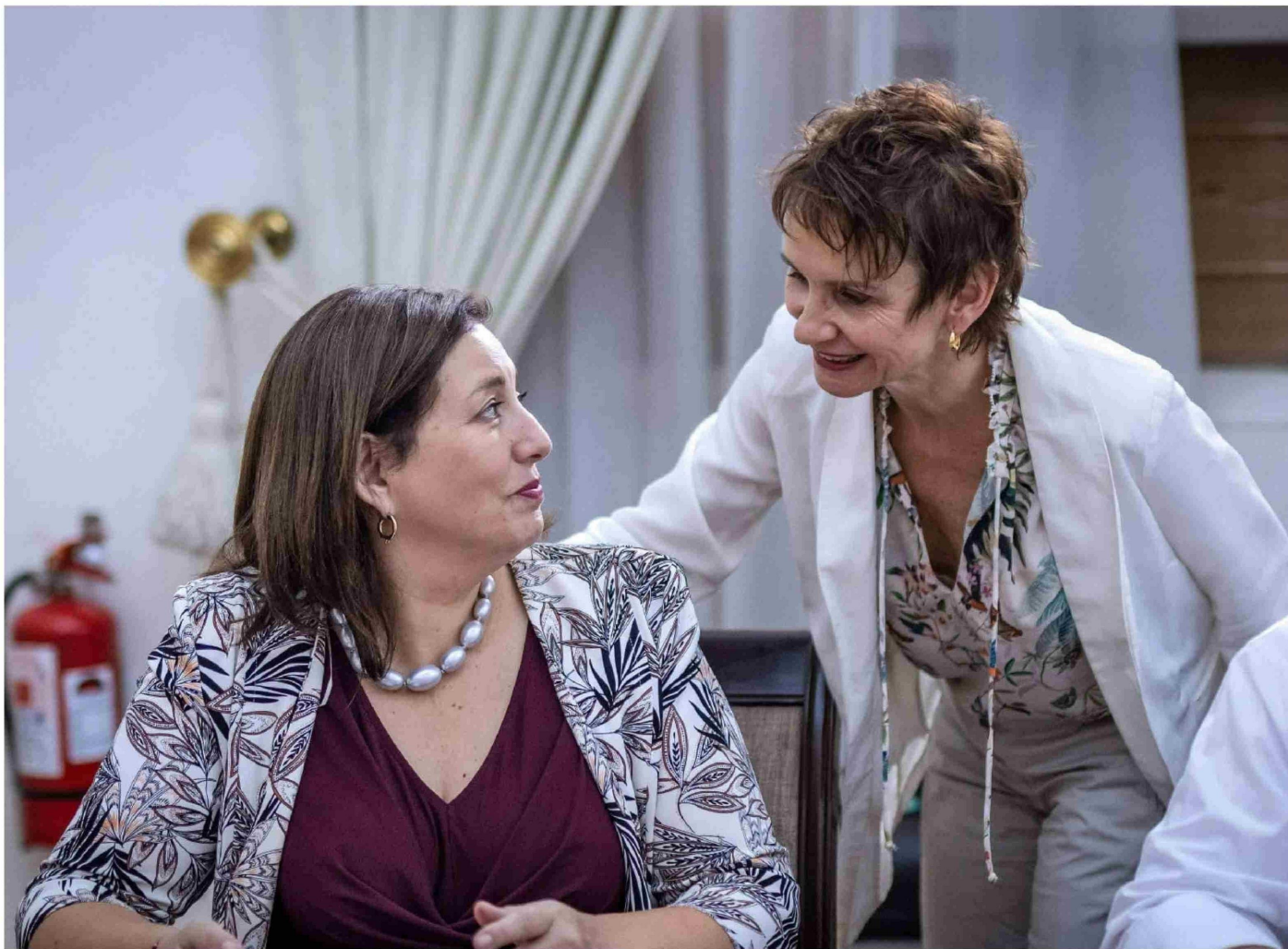
► La senadora Paulina Vodanovic, presidenta del PS, y la abanderada del Socialismo Democrático, Carolina Tohá.

Tiraje: 78.224 Lectoría: 253.149 Favorabilidad: No Definida