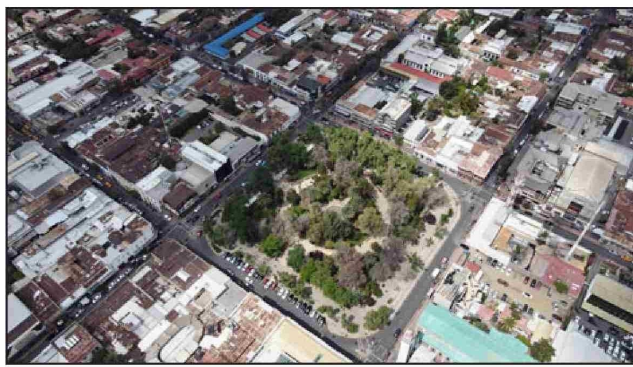
Con esto, se posiciona entre las comunas líderes de la Región de Valparaíso.