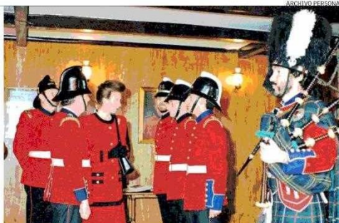
La princesa Ana de Inglaterra visitó la Compañía Británica de Bomberos en 1994. José Zagal a la derecha, con su gaita.