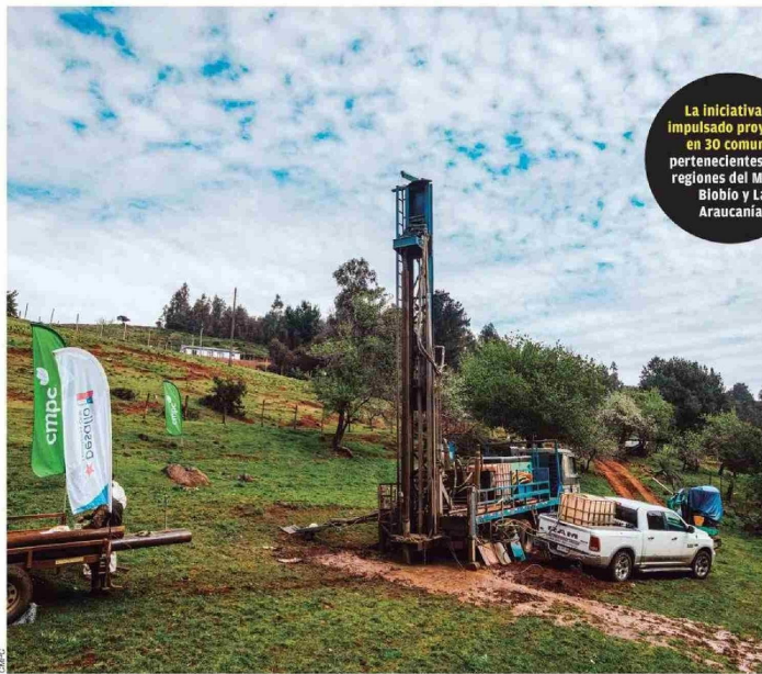
Construcción del sistema APR en Collipulli.