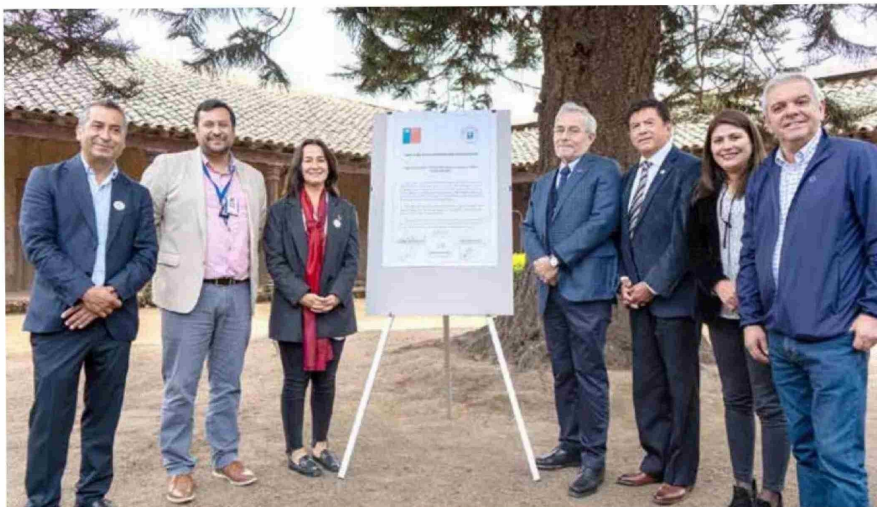
Autoridades respondieron a la convocatoria ligada a la firma del convenio.

El recinto, de propiedad de la Universidad Católica del Maule (UCM), solía ser un importante punto de encuentro para la comunidad, albergando exposiciones, actividades culturales, biblioteca, ferias costumbristas y diversas celebraciones, además de ofrecer la oportunidad de pasear en sus increíbles jardines y bosques. Sin embargo, tras el terremoto, entró a una fase de recuperación que ha avanzado gradualmente gracias al apoyo y financiamiento del Gobierno Regional, lo que ha permitido la realización de eventos