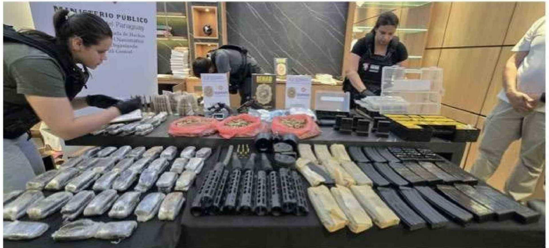
A finales de noviembre de 2025 se realizó un operativo en Paraguay que desarticuló a un grupo que enviaba drogas, municiones y componentes de armas al Comando Vermelho de Brasil.

Además, desde 2024 ha aumentado el número de aeronaves del narcotráfico procedentes de Venezuela interceptadas por la Fuerza Aérea Brasileña (FAB), casi siempre entre los estados brasileños de Roraima y Amazonas, en la región habitada por los indígenas Yanomami; la última interceptación tuvo lugar el 19 de diciembre. Se trataba de una pequeña Cessna 182P, detectada por las autoridades brasileñas mientras volaba sin plan de vuelo y con matrícula no identificada, probablemente ocultada o falsificada. El piloto, que realizó un aterrizaje