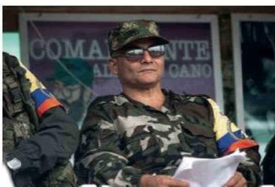
Néstor Gregorio Vera Fernández, alias Iván Mordisco, líder disidente de las Farc sobre quien pesa una recompensa de 1,35 millones de dólares, propuso una alianza entre facciones armadas para coordinar un frente "contra el imperialismo" de Estados Unidos.

Un informe del International Crisis Group sobre la triple frontera entre Perú, Colombia y Brasil, elaborado por el experto Bram Ebus, ya