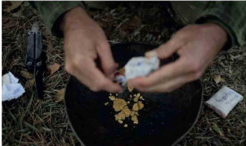
Oro confiscado en una operación contra la minería ilegal en 2023 en la reserva Yanomami en Boa Vista, estado de Roraima, donde una red criminal traficó oro ilegal hacia Venezuela por un valor estimado de 800 millones de dólares entre 2023 y 2024.

forzoso, logró huir. En septiembre fue interceptado un bimotor, también procedente de Venezuela, con más de 300 kilos de cocaína a bordo, y algunos meses antes, en febrero, otra aeronave cargada con droga fue obligada a realizar un aterrizaje de emergencia, con dos pilotos muertos en el acto.