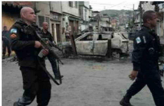
La policía pasa junto a un vehículo incendiado utilizado como retén durante un operativo policial contra presuntos narcotraficantes en la favela Complexo do Alemão, donde opera la organización criminal "Comando Vermelho", en Río de Janeiro, el martes 28 de octubre de 2025.

También existe el temor de que los acontecimientos en Venezuela amplifiquen y extiendan en Brasil el tráfico de fentanilo, que los guerrilleros colombianos de la Segunda Marquetalia, facción disidente de las FARC, han comenzado a explotar lentamente. En septiembre de 2025, una operación del Ejército Nacional Colombiano en Puerto Rondón (Arauca) condujo a la incautación de cientos de ampolillas de esta potente droga sintética. Estos lotes, registrados ante el Instituto Nacional de Vigilancia de Medicamentos y Alimentos (Invima), estaban destinados a hospitales, pero habían sido robados por los guerrilleros colombianos tanto para tratar a combatientes heridos como para abastecer de droga las zonas