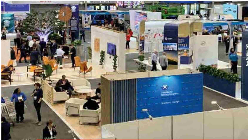
La feria se llevará a cabo entre el 24 y el 26 de junio en Lima

puestas concretas para el futuro de la minería.