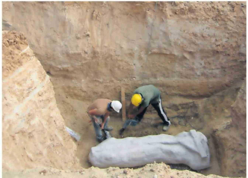
La investigación usó antecedentes de monitoreos a obras en Coquimbo.