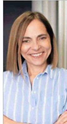
Isabel Plá, exministra y militante UDI.