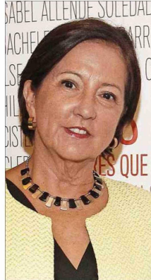
Soledad Alvear, exministra y militante de Amarillos.