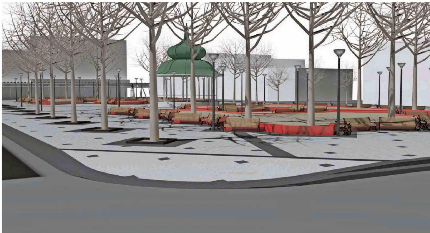
INTERVENCIÓN EN LA PLAZA DE LA REPÚBLICA ES PARTE DEL PLAN DE MEJORAMIENTO DEL CASCO HISTÓRICO DE VALDIVIA, SEGÚN EXPLICARON DESDE LA MUNICIPALIDAD.

COMUNICACIONES MUNICIPALIDAD DE VALDIVIA