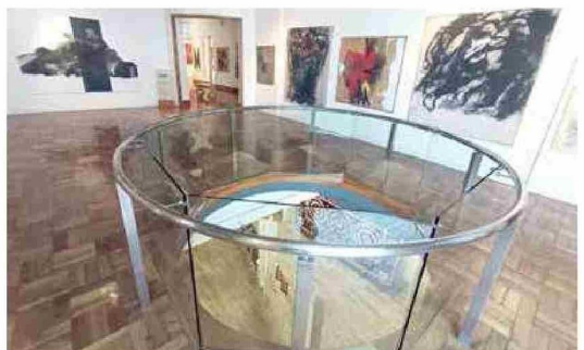
Entre sus pisos, la NUGA ofrece gran variedad de técnicas en sus obras.

pretación de su entorno con el fin de recrear el paisaje de la ensoñación y su propia configuración de la realidad. La visita para este compilado internacional estará disponible para los interesados hasta el día viernes 30 de enero y