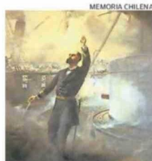
PRAT PASÓ A LA HISTORIA EL 21 DE MAYO DE 1879 EN LA RADA DE IQUIQUE.

El Archivo Central Andrés Bello de la Universidad de Chile, en el marco del centenario del Tribunal Calificador de Elecciones (Tricel), celebrado en julio de 2025, reimprimió el documento histórico que permite evidenciar una faceta menos