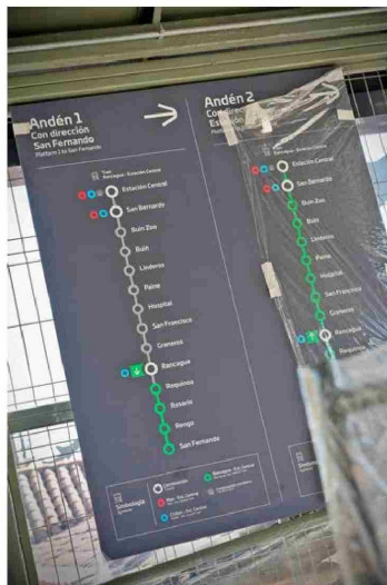
De acuerdo al presidente de EFE, se espera que las estaciones estén operativas desde la primera quincena de marzo.