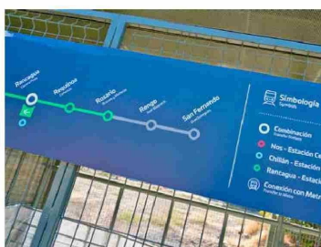
Las estaciones de Requínoa y Rosario hacen parte del recorrido Estación Central - San Fernando.