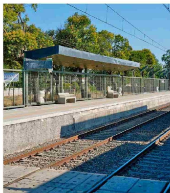
Estas obras de restauración podrían a beneficiar a cerca de 30 mil personas.

En el año 2023, desde el Gobierno Regional de O'Higgins se hizo firma de la resolución que otorga el financiamiento para el proyecto de conservación de la estación de trenes de Requínoa. Para el año 2024, se dio inicio a las obras de conservación para dicha estación, así como para la de Rosario. Hoy, poco más de dos años después de firmar la resolución, finalmente fueron restauradas ambas estaciones, lo que significa que aproximadamente 30 mil personas serán beneficiadas ahora que el transporte ferroviario retomará sus detenciones en Requínoa y Rosario. El proyecto involucró una inversión mayor a los 1.370 millones de pesos por parte del Gobierno Regional junto al Consejo Regional, y contempló el mejoramiento de la boletería, accesos universales, espacios para espera del público, señalética, alzamiento y extensión del andén, pavimentos, pintura, entre otros trabajos. Tras el anuncio, Eric Martín, presidente de la Empresa de los Ferrocarriles del Estado (EFE), manifestó que "nuestro horizonte es que la primera quincena de marzo ya estemos en etapa de operación".