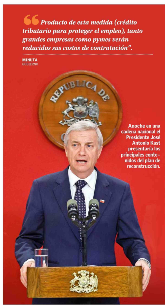
Producto de esta medida (crédito tributario para proteger el empleo), tanto grandes empresas como pymes verán reducidos sus costos de contratación". MINUTA GOBIERNO

Por las medidas del plan de "reconstrucción" también figuran la ampliación del plazo y de la tasa para la repatriación de capitales y la suspensión por 4 años en el ingreso de nuevas instituciones a la gratuidad.