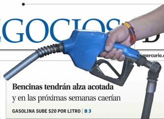
Bencinas tendrán alza acotada y en las próximas semanas caerán GASOLINA SUBE $20 POR LITRO | B 3