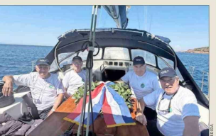
Excadetes de la Escuela Naval lanzaron una ofrenda floral en el mar Egeo, frente al templo de Poseidón, en las costas de Grecia.

surcaron el mar Egeo a bordo de cuatro veleros para rendir un homenaje "al valor, la entrega y el legado de los héroes del Combate Naval de Iquique y a las Glorias de la Armada". Los excadetes formaron en una columna y lanzaron al mar una ofrenda floral frente a las columnas del templo de Poseidón, en cabo Sounion, Atica. Casi 2 mil kilómetros al oeste, la Embajada de Chile en España también realizó un acto para rendir homenaje "al valor, la entrega y el legado de los héroes que marcaron nuestra historia en el mar", escribiendo junto a indígenas de la conmemoración que compartieron en sus redes sociales. "Esta fecha tan significativa nos invita a recordar nuestros raíces y a renovar el compromiso con los principios y valores que inspiran a nuestra nación", añadieron.