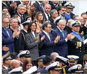
CEREMONIA. — Las principales autoridades del país rindieron honores a los Héroes de Iquique, en la plaza Sotomayor, en Valparaíso.