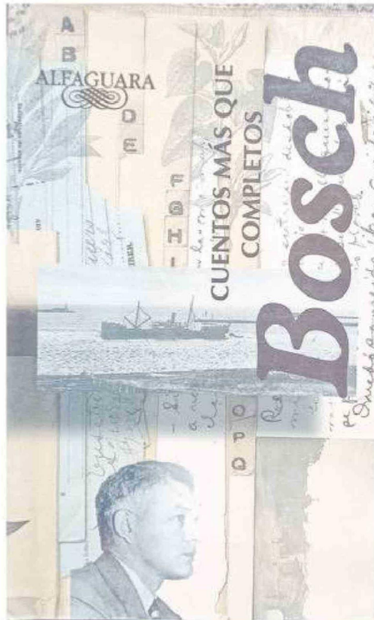
Portada de la primera edición del libro que recrea la estadia del autor dominicano en nuestro país entre 1955 y 1956.

A menudo se asocia a Juan Bosch con ideas marxistas, de hecho durante buena parte de su vida colaboradores y adversarios lo tildaron de comunista, afirmación que cada cierto tiempo salía a desmentir.