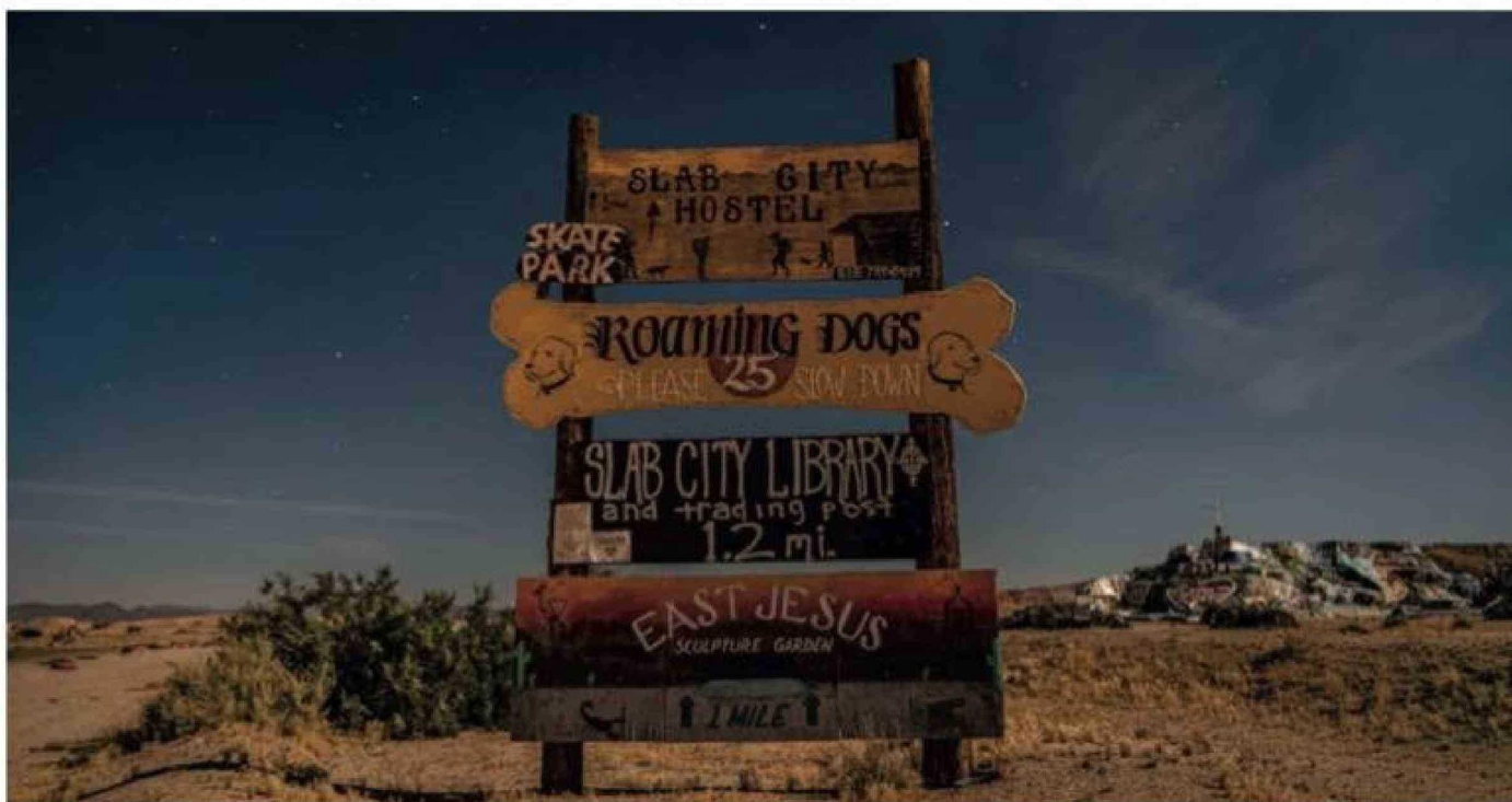
Durante el verano, por las temperaturas extremas, muchos habitantes migran hacia otros sitios.