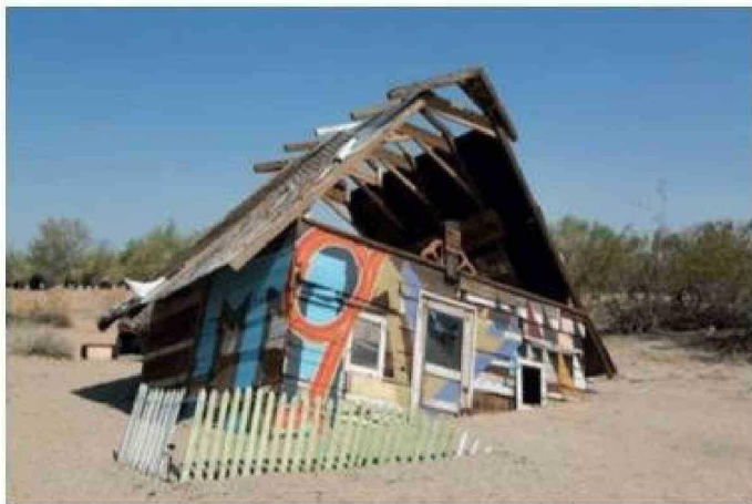
Algunas de las casas que se construyeron en Slab City.

Título: El extraño pueblo de EE.UU. en el que se vive sin luz, agua, ni impuestos y donde la basura se convierte en arte