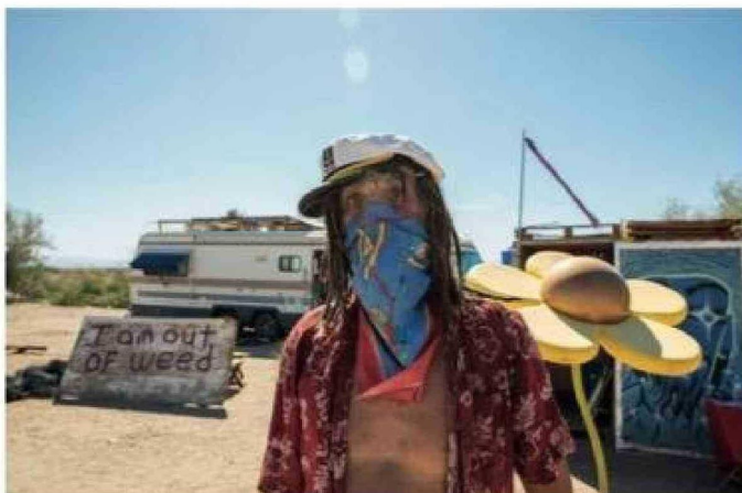
Slab City es un pueblo creado dentro de una base del Ejército de Estados Unidos.

El futuro de Slab City, sin embargo, es incierto. La amenaza