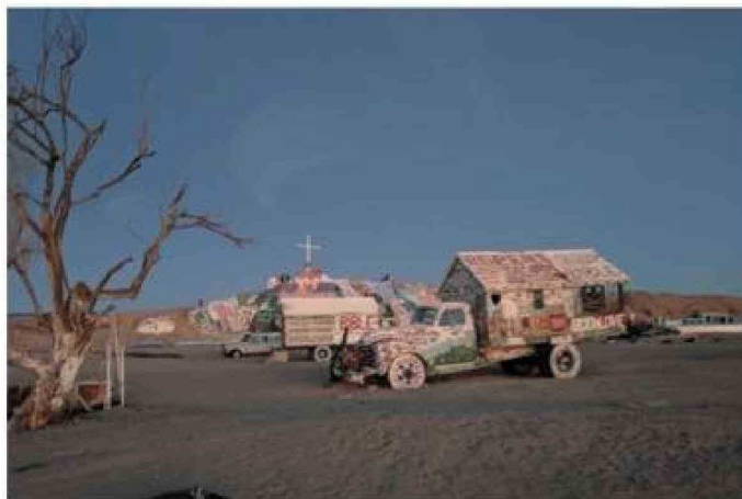
Algunos vehículos intervenidos en Slab City.

de desalojo flota como un fantasma sobre los residentes. Para muchos, la desaparición de este enclave sería el fin del "último lugar libre de Estados Unidos". La resistencia, por ahora, es silenciosa: un acto cotidiano de permanecer y cuidar lo que otros consideran tierra de nadie.