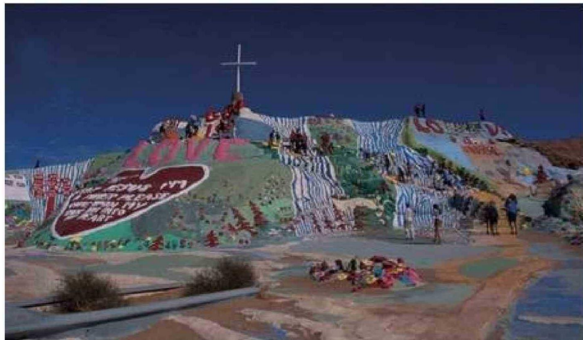
Una de las obras de arte que se pueden encontrar en Slab City.

ejercicio de resistencia. El termómetro puede trepar hasta los 50° centígrados en verano. Cuando eso sucede, la mayoría de los visitantes recogen sus cosas y parten. Solo quedan unos 150 habitantes permanentes para enfrentar el desierto, el silencio y la oscuridad. "Lo más seguro es quedarse quieto", advierte una mujer de cabello desordenado, que antes era ejecutiva de marketing en Seattle y hoy rebusca ropa entre bolsas olvidadas.