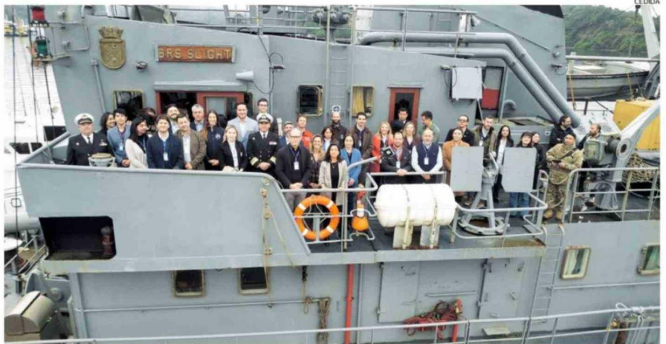
EN UN BUQUE DE LA ARMADA SE REALIZÓ PARTE DE LA JORNADA EN QUE SE EXPLORÓ LA ECONOMÍA AZUL EN LOS LAGOS.