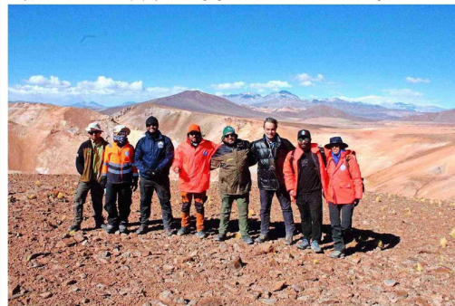
EQUIPO. En la expedición también participaron miembros de Socorro Andino, la Asociación de Turismo de Atacama y Conaf. Aquí, en el portezuelo donde Mermoz fue atrapado por una corriente descendente.