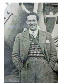
AVIADOR. Jean Mermoz desapareció en el Atlántico en 1936. Tenía 34 años.