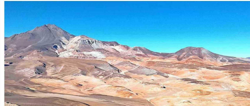
CORDILLERA. Arriba, la búsqueda del "Plateau de los Tres Cóndores" se realizó en dos vehículos todoterreno. Abajo, vista hacia el volcán Copiapó y la cuenca geográfica donde Mermoz aterrizó de emergencia.