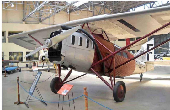
AERONAVE. Un modelo del Latécoère 25 en el que voló Jean Mermoz se conserva en el Museo Nacional de Aeronáutica de Morón, provincia de Buenos Aires.

Collenot fue a buscar sus herramientas y ambos se pusieron a trabajar, a más de 4.000 metros de altura y con 15 grados bajo cero de temperatura. Retorcieron alambres, extrajeron piezas secundarias e intentaron hacer funcionar nuevamente el motor. Posteriormente, sacaron los asientos, los tanques de combustible, la rueda