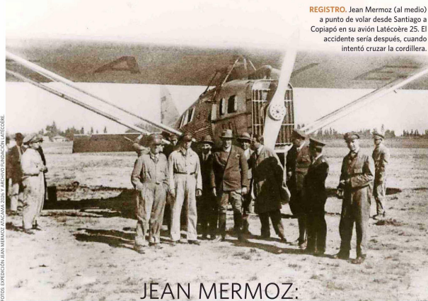
REGISTRO. Jean Mermoz (al medio) a punto de volar desde Santiago a Copiapó en su avión Latécoère 25. El accidente sería después, cuando intentó cruzar la cordillera.