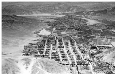
PASADO. Así se veía Copiapó desde el aire en los años 30. Al lado, los barrancos y caminos mineros del sector donde aterrizaron Mermoz y Collenot. Esta historia quedó contada en la biografía Mermoz , escrita por Joseph Kessel, amigo del piloto.

“Hallamos vestigios de ocupación inca y preinca en los alrededores del plateau descrito por Mermoz”, dice Marc Turrel, so-