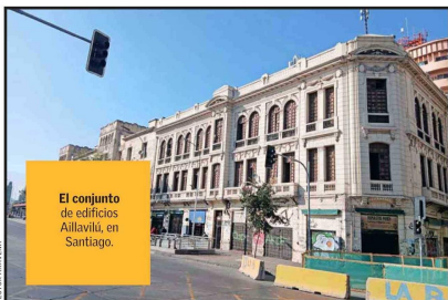
El conjunto de edificios Aillavilú, en Santiago.

Tenemos que pensar en otras funciones contemporáneas, como, por ejemplo, readaptar esos inmuebles para la vivienda en espacios para la convivencia democrática o para colegios”.