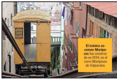
El icónico ascensor Mariposas fue construido en 1934, en el cerro Mariposas de Valparaíso.