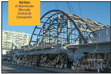
Así luce el deteriorado Mercado Central de Concepción.